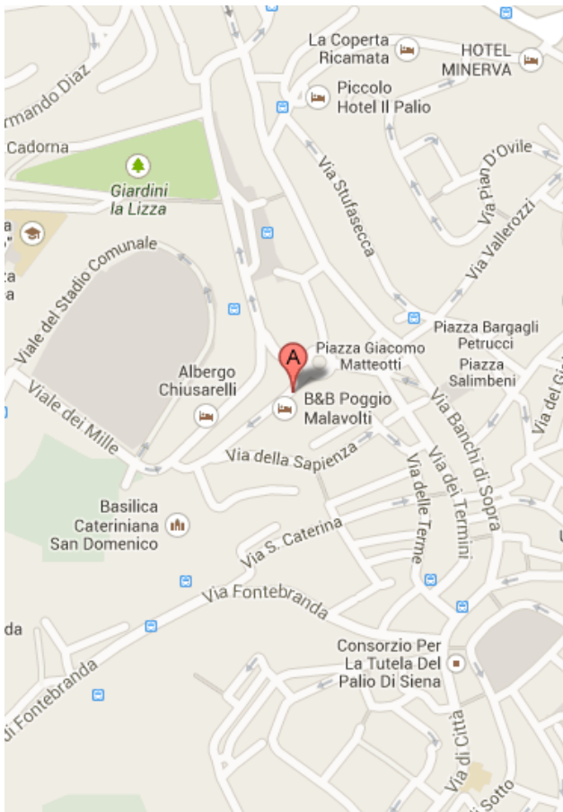
Siena, via del Paradiso 16