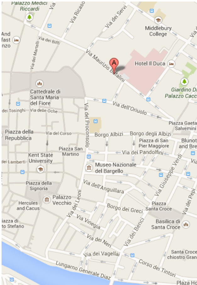
Florenz, via Bufalini 3